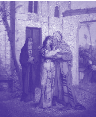
«Nathan der Weise»