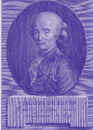
Jean-François Pilâtre de Rozier

1783 komponierte Wolfgang Amadeus Mozart innerhalb weniger Tage seine Sinfonie C-Dur KV 425 «Linzer». Und was geschah noch in diesem Jahr?