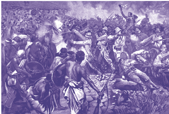
Schlacht von Adua